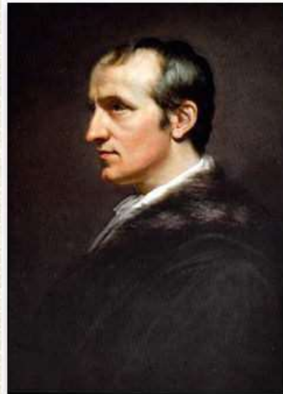
William Godwin (1756-1836)